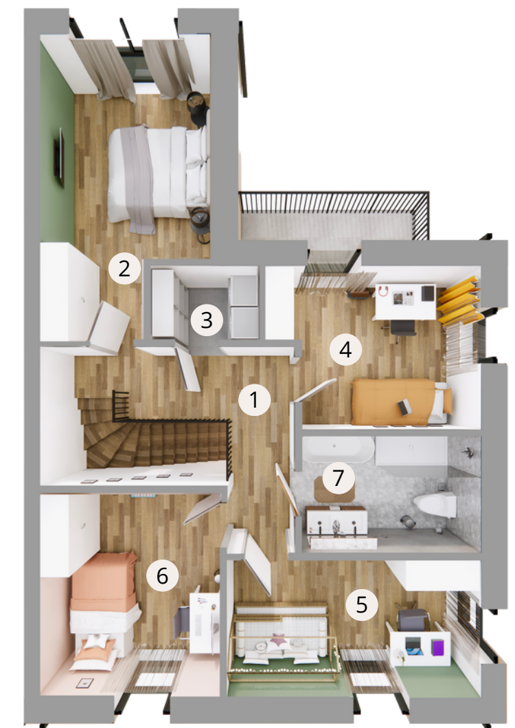
Piętro 64,95 m 2