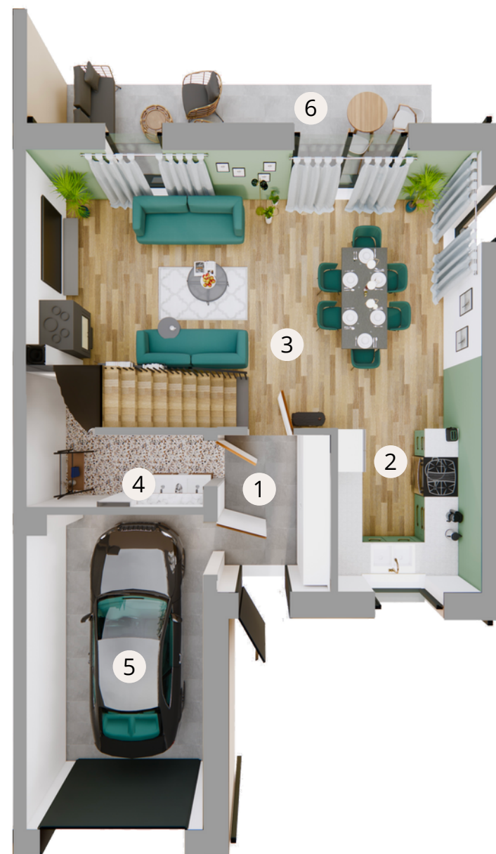
Parter 70,06 m 2

Powierzchnia terenów zielonych: 227,61 m 2